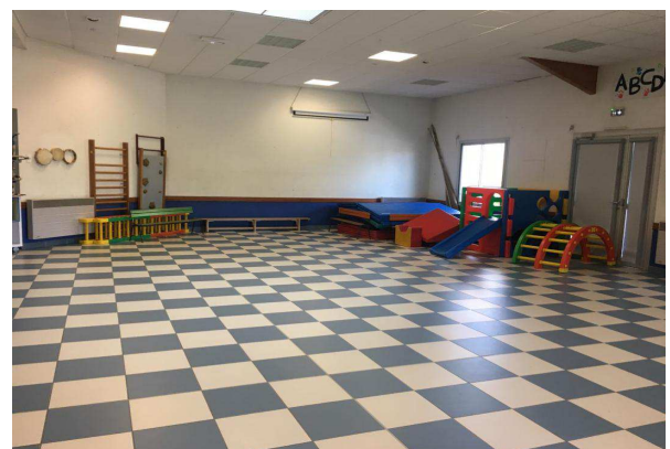
La salle de motricité