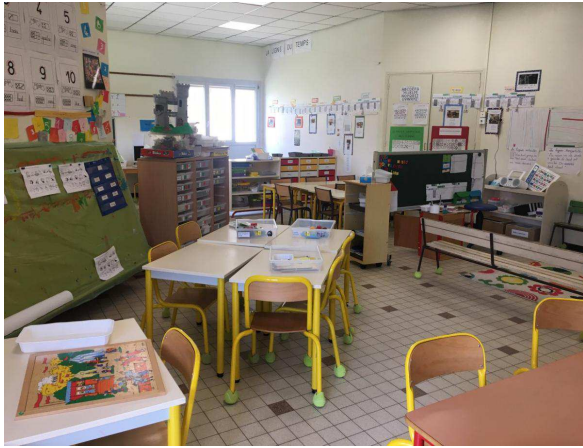
Une salle de classe