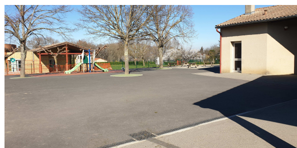
La cour de récréation